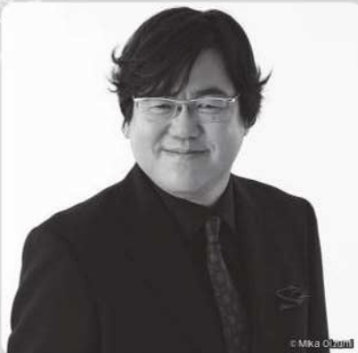
なかがわ けんいち 中川 賢一 (ピアニスト)